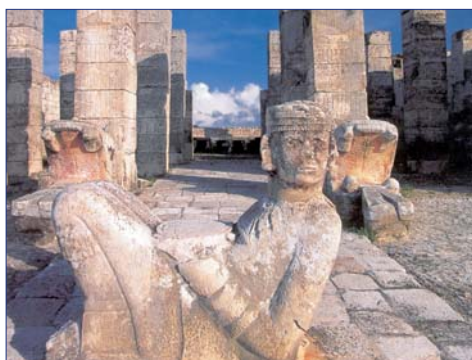
Chichén Itzá, Chac Mool

Der heutige Fahrttag endet in der kolonialen Städteperle Mérida, das wirtschaftliche und kulturelle Zentrum Yucatáns. F