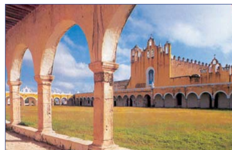
Izamal, Klosterkirche San Antonio de Padua

3. Tag (FR): MERIDA – CELESTUN – YAXCOPAIL – CAMPECHE (340 Km) Bei Ihrem morgendlichen Rundgang durch Mérida lernen Sie die Kathedrale, den Palacio Municipal und das Geburtshaus des Stadtgründers – das Casa de Montejo – kennen. Mérida beeindruckt mit kolonialem Charme, engen Straßen und romantischen Pferdedroschken. Überall in der Stadt ist der Einfluss Spaniens und Frankreichs spürbar. So diente zum Beispiel die Champs-Élysées als Vorbild für den Boulevard Paseo de Montejo. Weiter geht es in den kleinen Fischerort Celestún. Von hier aus unternehmen Sie eine Bootstour zur Vogelbeobachtung in der Lagune: Beeindruckende Kolonien von Rosa Flamingos und anderer Vogelarten besiedeln dieses sensible Ökosystem. Der anschließende Besuch zweier Süßwasserquellen lädt zum Schwimmen und Entspannen ein.