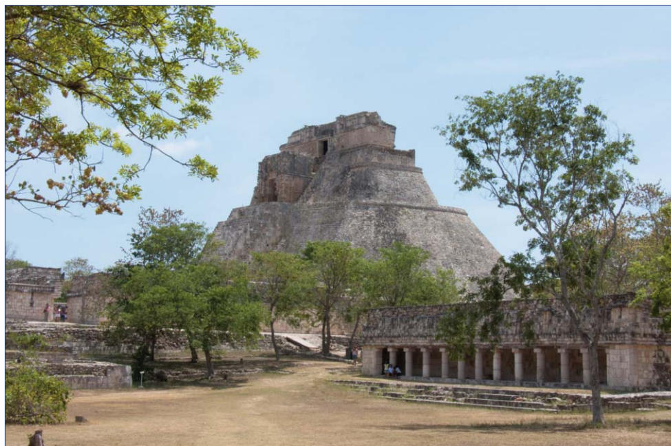
Uxmal, archäologische Zone

Weiterfahrt nach Uxmal - tauchen Sie in die Geschichte der spätclassischen Maya-Epoche ein. Der Name Uxmal steht für „die dreimal Erbaute“. Ungefähr 600 - 950 n. Chr. entstanden, konnte die Bedeutung vieler Bauten bis heute noch nicht vollständig entschlüsselt werden.