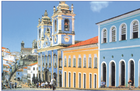
Salvador da Bahia

7. Tag (DI): FOZ DO IGUASSU – SALVADOR DA BAHIA Vormittags Fahrt zum Flughafen von Iguassu und Linienflug als Umsteige Verbindung nach Salvador da Bahia mit Ankunft am Abend. Empfang durch die örtliche Reiseleitung und Transfer zu Ihrem Hotel. F