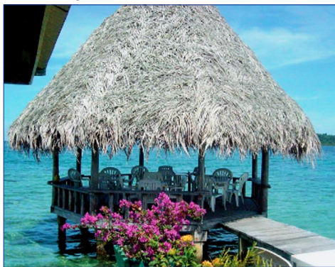
Bocas del Toro

7. Tag (MI): CAHUITA – SIXAOLA – BOCAS DEL TORO (100 Km) Morgens eine kurze Fahrt hinein in den Nationalpark Cahuita. Entdecken Sie auf einer Wanderung durch den Park zahlreiche Vogelarten und Faultiere, Affen und weitere Dschungelbewohner.