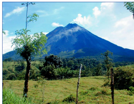
Arenal Nationalpark, Vulkan

3. Tag (SA): ARENAL – TAGESAUSFLUG NATIONALPARK ARENAL (20 Km) Nach dem Frühstück unternehmen Sie eine Wanderung durch den Arenal Nationalpark, den Vulkan immer im Blick. Später kommen Sie durch einen kleinen Wald bis zu einem imposanten Lavafeld aus dem Jahr 1992. Im Anschluss daran wandern Sie über die zwischen den Bäumen gespannten und sicher begehbaren Hängebrücken und beobachten hierbei die interessante Natur. F