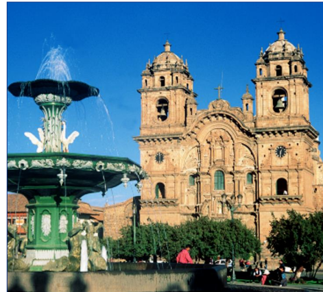
Cusco, Iglesia de la Compañía

Von Pisac aus fahren Sie weiter nach Cuyo Grande. (€) Von hier aus haben wir eine etwa 3-stündige Wanderung bis nach Chahuaytiri für Sie eingeplant. Unterwegs können Sie alte Wandmalereien sehen und besuchen eine Genossenschaft von Weberinnen. F