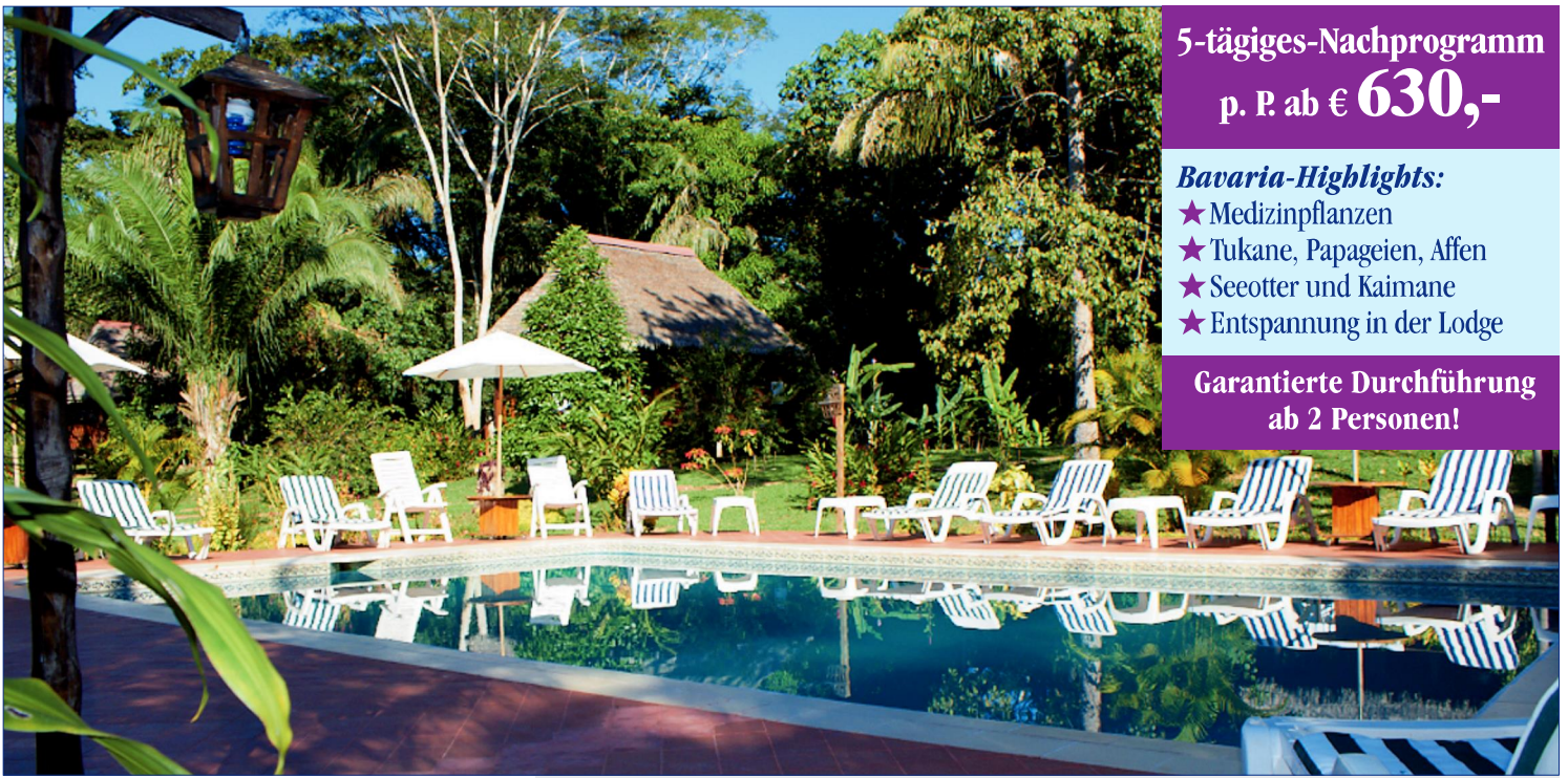
Lodge Corte Maltés