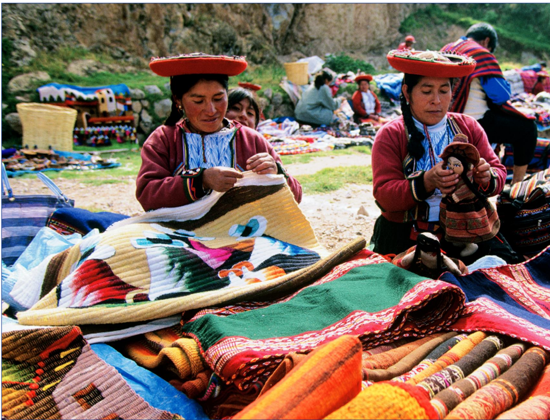
Markt bei Cusco

13-Tage-Erlebnisreise p. P. ab € 3.578,-