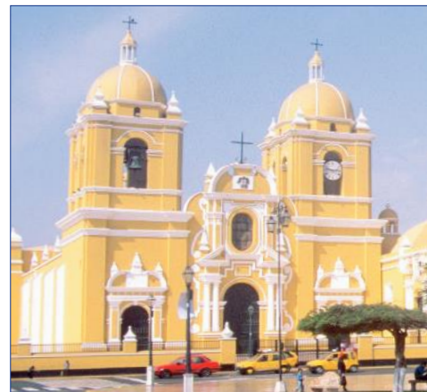
Trujillo, Plaza de Armas

Im Laufe des späten Nachmittags Transfer zum Flughafen und Rückflug mit einer Linienmaschine nach Lima. Empfang durch die örtliche Reiseleitung und Transfer in Ihr Hotel. F