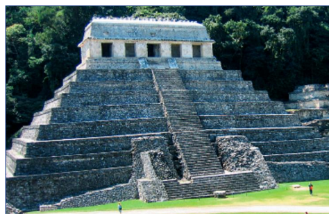
Palenque, Tempel der Inschriften

20. Tag (SO): DEUTSCHLAND Nachmittags Ankunft an Ihrem Heimatflughafen.