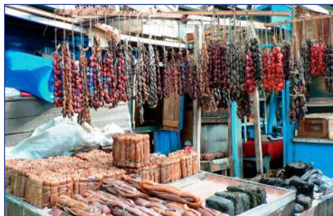
Puerto Montt, Fisch- und Kunsthandwerkmarkt

Später fahren Sie den Vulkan Osorno hinauf. Die Straße endet in 1.300 m Höhe an einer Berghütte – die Ausblicke von hier auf den sich auftürmenden Vulkan Osorno und die umliegenden Vulkane Calbuco, Antillanca, Tronador und den tiefblauen Llanquihue See bleiben unvergesslich. Bei gutem Wetter können Sie die Landschaft auch bei einer Fahrt mit dem Sessellift genießen (fakultativ). F