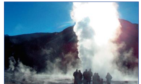
Geysire von Tatio