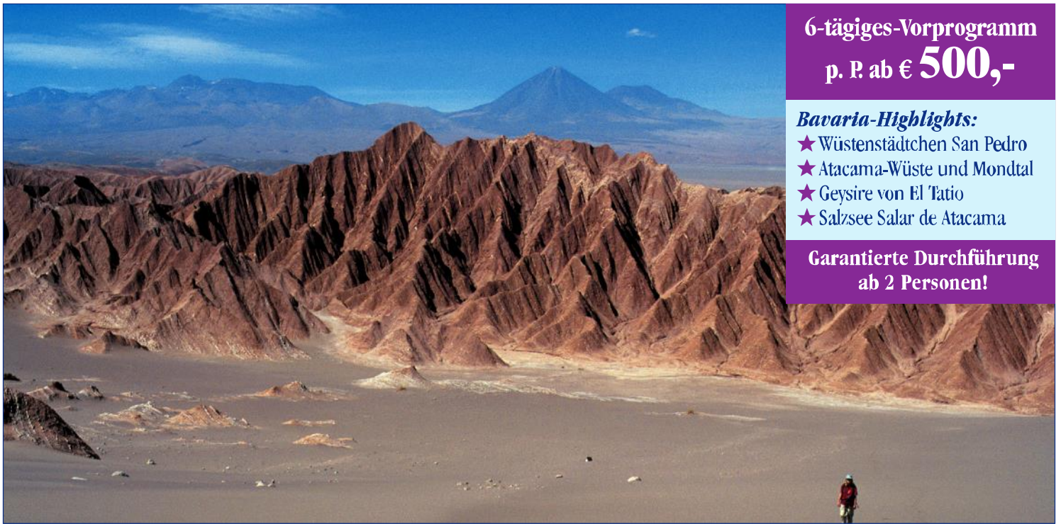
Valle de la Luna, Atacama-Wüste