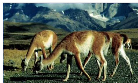
Guanacos im Torres del Paine-Nationalpark

Im Anschluss Fahrt zum Flughafen von Punta Arenas und Rückflug nach Santiago de Chile. F