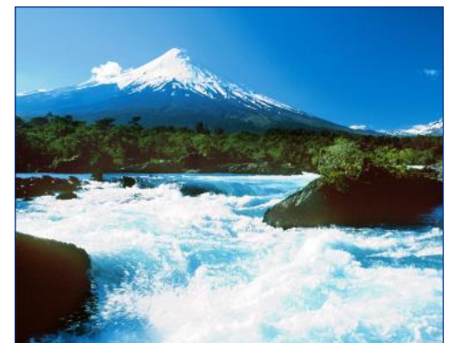
Salto de Petrohué

2. Tag (SO): SANTIAGO DE CHILE Nach Ankunft Begrüßung durch die lokale Reiseleitung und Transfer zu Ihrem Hotel. Genießen Sie am Nachmittag eine Stadtrundfahrt mit Besichtigung der historischen Innenstadt und des Bergs San Cristóbal.