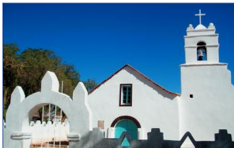
Kirche von San Pedro de Atacama

6. Tag (MO): SAN PEDRO – SANTIAGO DE CHILE – PUERTO VARAS Morgens Transfer zum Flughafen Calama und Flug nach Santiago de Chile. Hier treffen Sie mit den Teilnehmern des Basisprogrammes „Chile - der Süden“ zusammen und fliegen gemeinsam weiter in das chilenische Seengebiet nach Puerto Montt. F